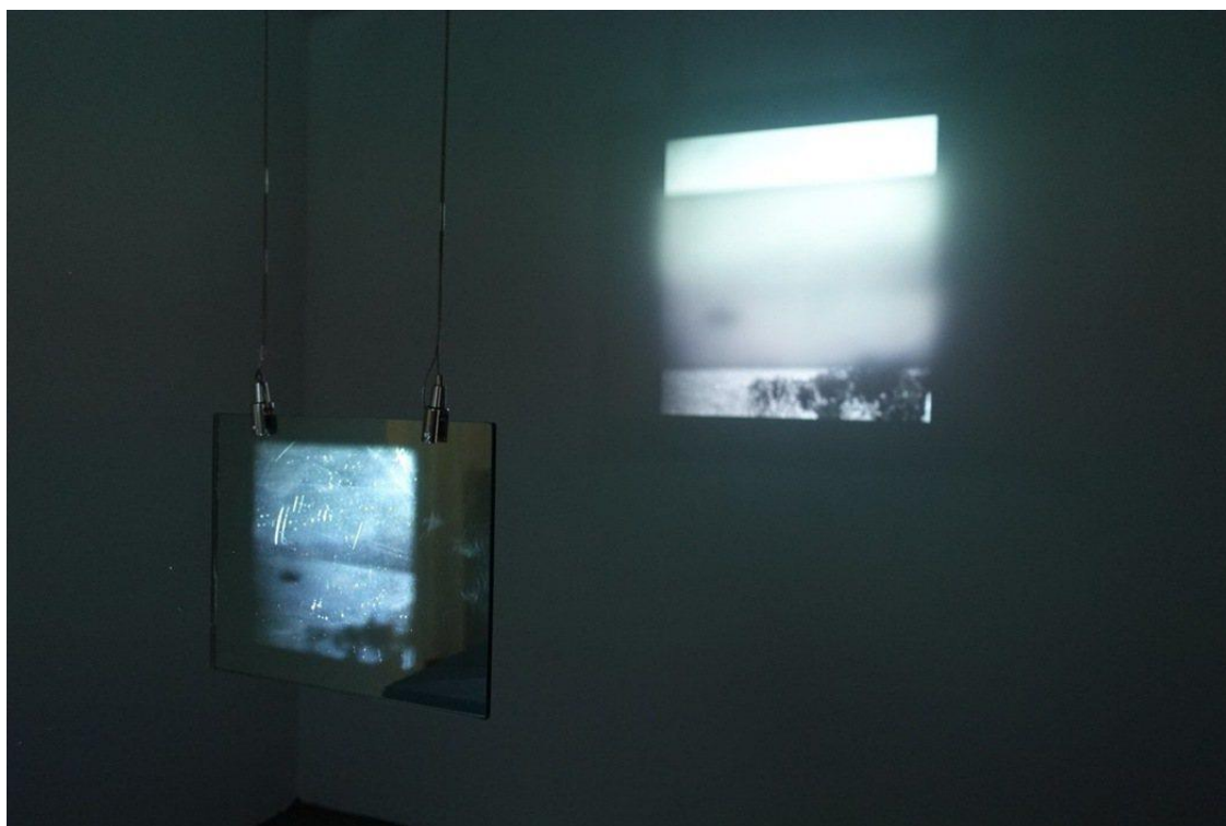
謝雨庭-BELIEVING IS SEEING-開幕現場。