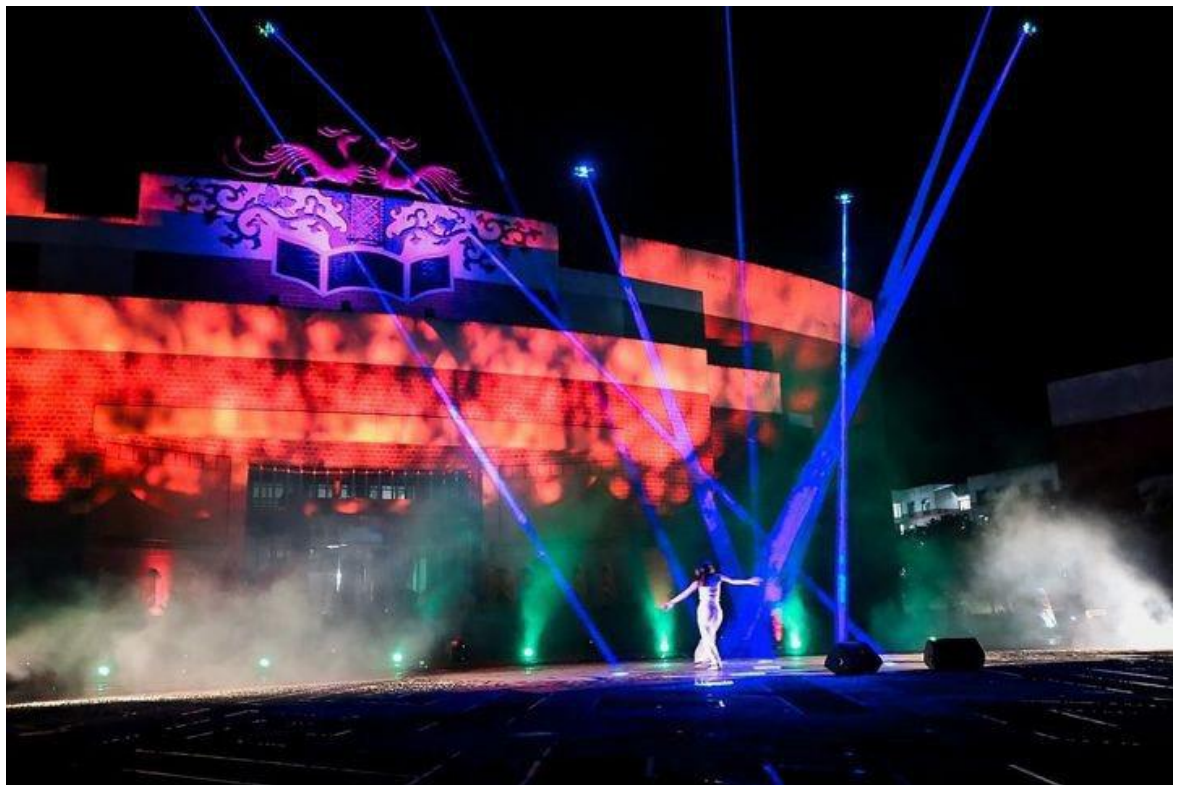
「有重量的光束」展演現場照(2)。

昨(16)日晚上七點登場的「未竟之人」，主題為「有重量的光束」，導演為動畫藝術與影像美學所副教授羅禾淋；校長詹景裕、陽明交大終身講座教授林一平、台灣大學教授洪一平監製；實踐大學教授龔志銘擔任技術總監，此次展演結合了 AI、燈光與無人機的跨領域合作。並鏈結了南藝大、陽明交大、實踐大學等優秀的學生們一同製作。