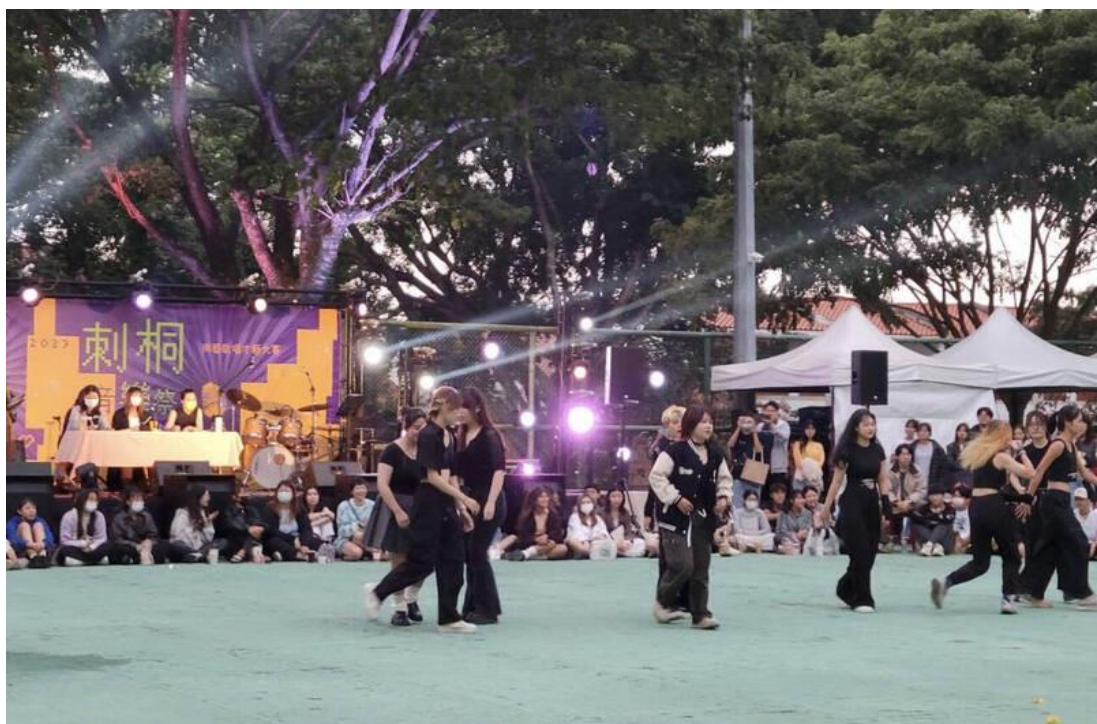
南藝大「刺桐音樂祭」。