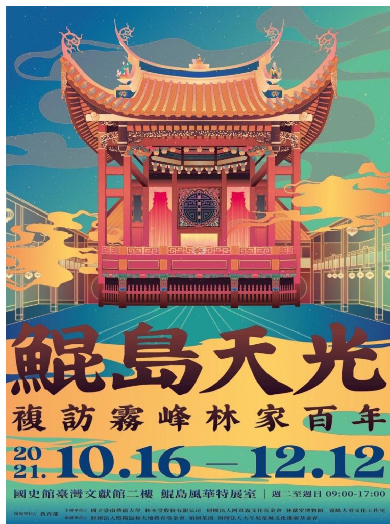
鯤島天光海報。

臺灣民主化過程中，樟腦扮演著什麼樣的角色嗎？霧峰林家從平定小刀會、太平天國戰功不斷的林文察，到協助劉銘傳中法戰爭的林朝棟，及成功從武轉文考上舉人的林文欽，在頂厝與下厝合力掌控了中路撫墾大權與樟腦專賣特許因而致富後，臺灣民主先驅林獻堂先生就是在此時空背景與成長環境下，得以全力推動臺灣民主發展運動。