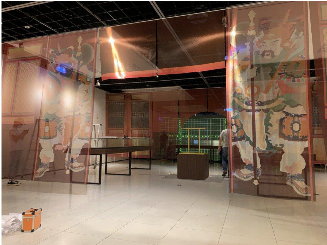
佈展過程。

鯤島天光—複訪霧峰林家百年展覽，於 10 月 16 日下午 2 點 30 分在南投國史館臺灣文獻館二樓盛大開幕。展覽共分為四個展區：從地方豪強到封疆大吏、轉型與蛻變—林獻堂與臺灣文化協會、雪泥鴻爪—臺灣文化協會與藝術文化活動，與虛擬實境—再現「阿罩霧」等四個單元。除了展出珍貴文物「宮保第」門額原件、臺灣文化協會、台中中學等相關檔案、照片外，更將透過沉浸式光影技術打造藝術夢境，呈現霧峰林家與臺灣民主發展的關係及其建築之美。